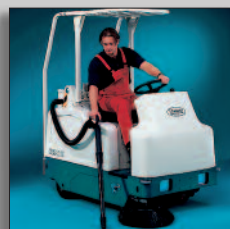
Bestuurdersbeschermerk en zuigslang