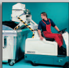
Vuilvergaarbak te legen op variabele hoogte