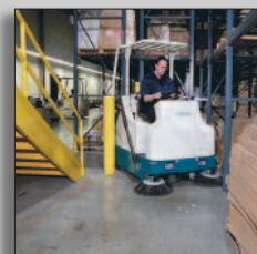
Machine in actie