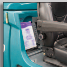
Geïntegreerd 4L FaST-PAK